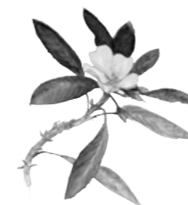
La jussie et sa belle fleur jaune